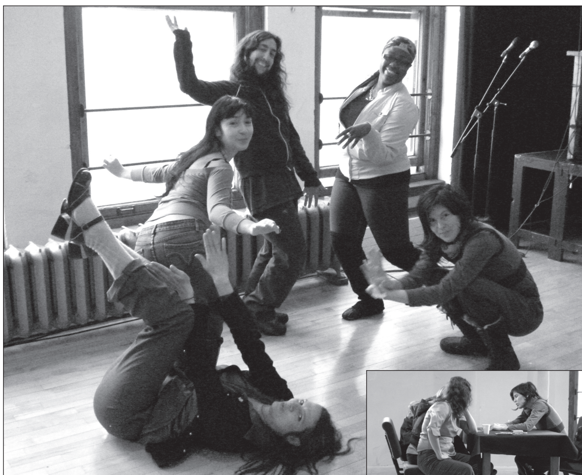
Edgy Careers at the Edgy Women Festival