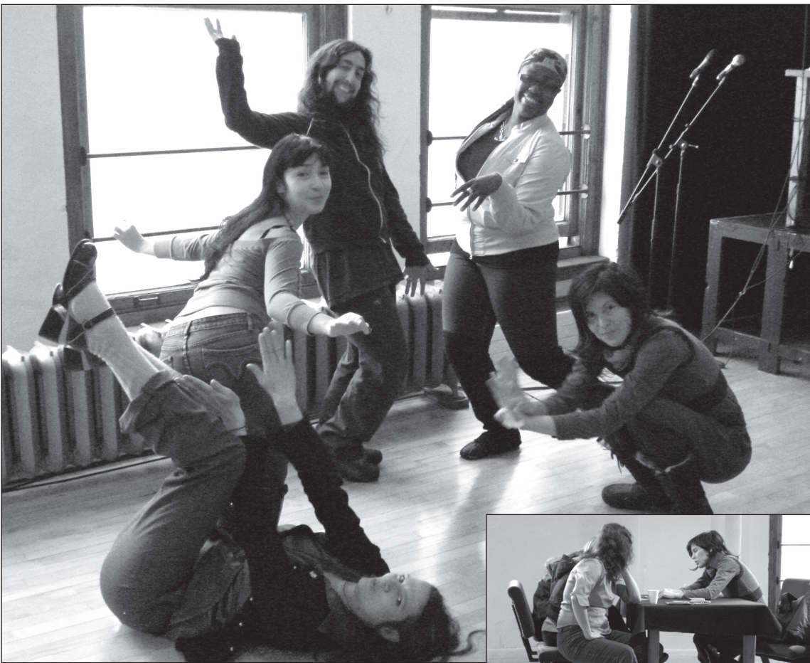
Carrières Edgy au Festival Edgy Women