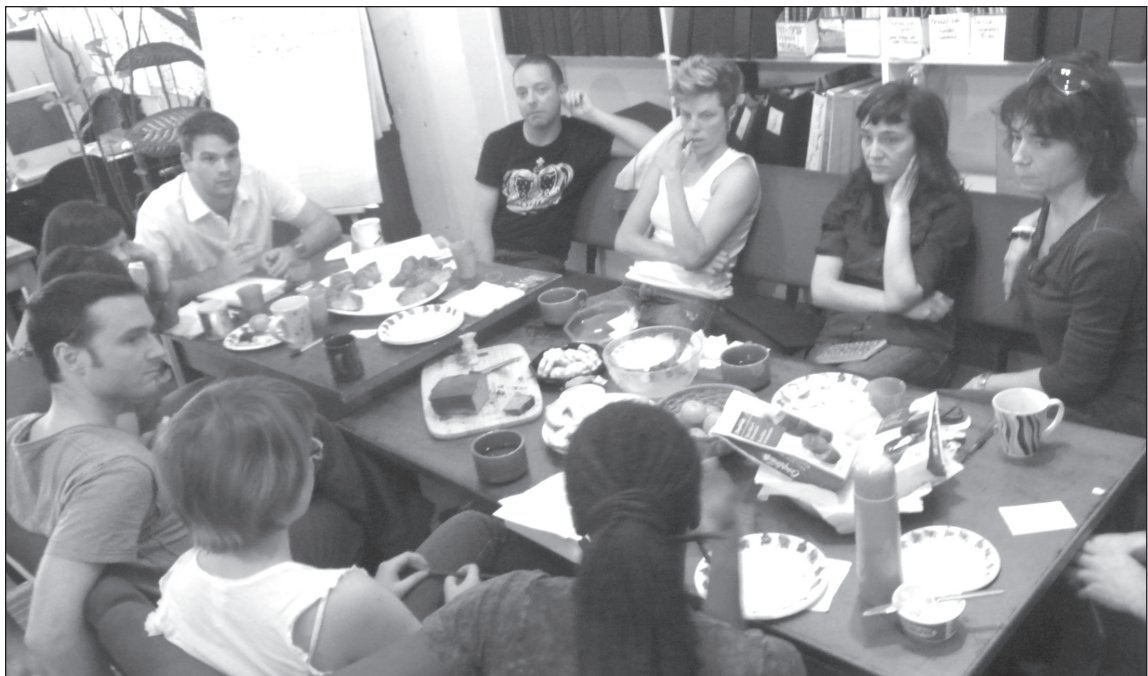
Discussion at 303, décembre 2008