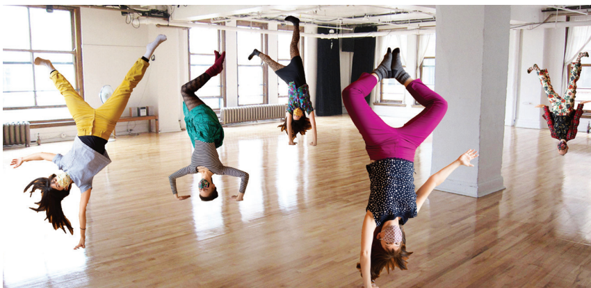
Team 303 par Kinga Michalska, montage par Noël Vézina